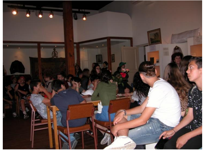
...η κούραση αρχίζει να φαίνεται !